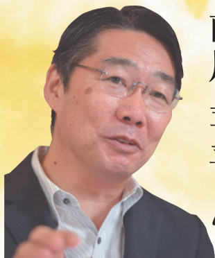
元 文 部 科 学 省 事 務 次 官 前川 喜平さん