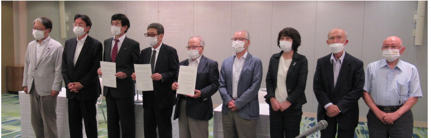
立憲民主党県連・新政信州との確認書締結式