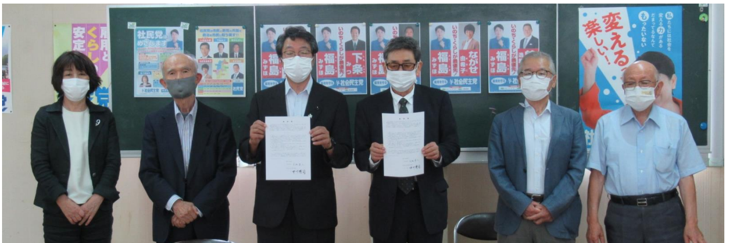
社会民主党県連合との確認書締結式